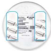
Dwustronne paski samoprzylepne