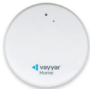
Urządzenie Vayyar Home